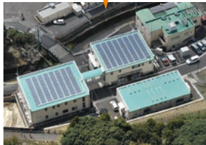
みんなの発電所 コミュニティソーラー