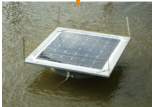
ソーラー水浄化装置